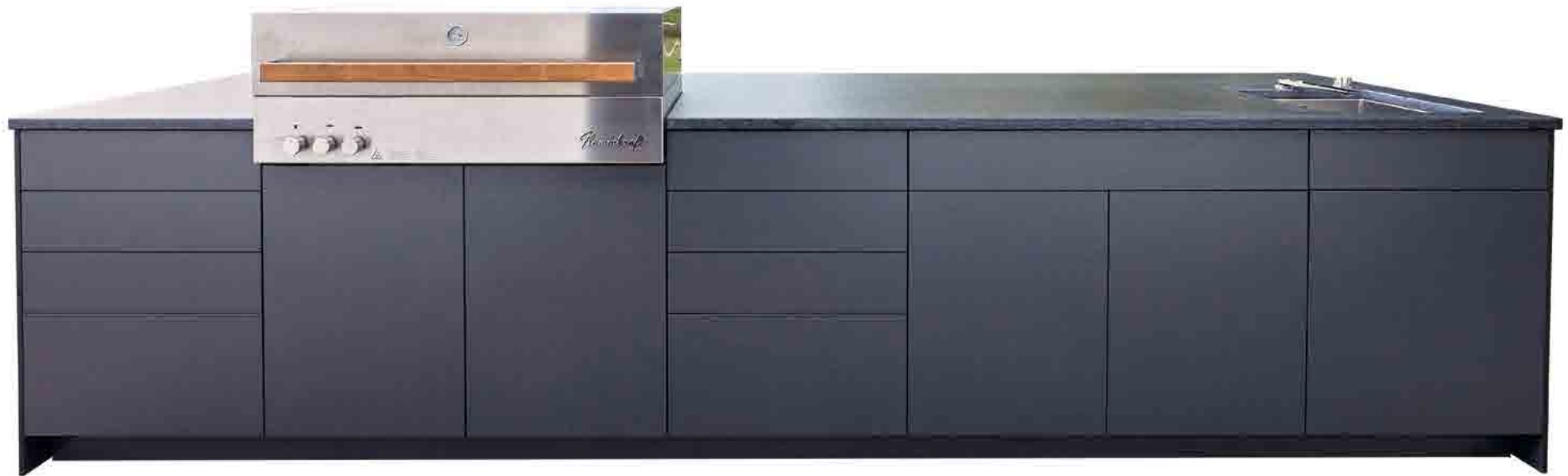
▲ Modellvariante K1

Um Ihnen die Qual der Wahl etwas zu erleichtern, bieten wir Ihnen vier verschieden ausgestattete Basis-Varianten. Von der Komplettküche (Modellvariante K1) mit Premium-Grill, Spüle, Kühlschrank-Schublade und riesiger Arbeitsfläche bis hin zum optimalen „kompakten“ Grillplatz (Modellvariante K4) – alles ist möglich und individuell auf Ihre Bedürfnisse abgestimmt.