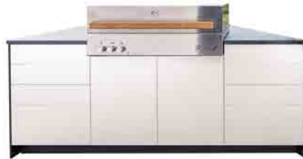
▼ Rosso Multicolor satinert

Bei den HPL-Oberflächen für die Fronten und Verkleidung gibt es keine Limits. Egal ob Fantasie-Muster, Metall, Holz, Stein, ... jedes Design lässt sich dank flexibler Produktionstechnik realisieren.